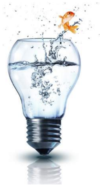
Innovative offentlige anskaffelser