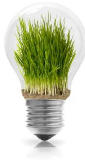
Klimavennlige offentlige anskaffelser