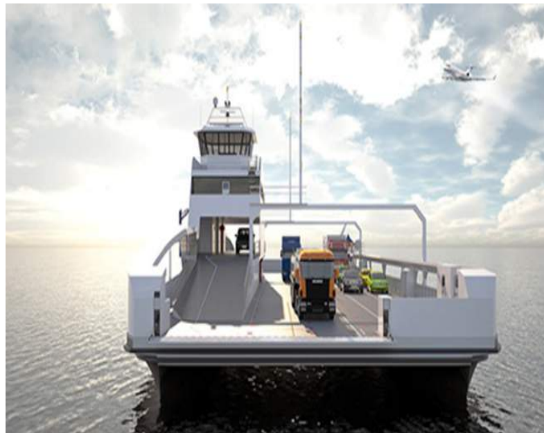
Lavik-Oppedal elektrisk («Ampere»)