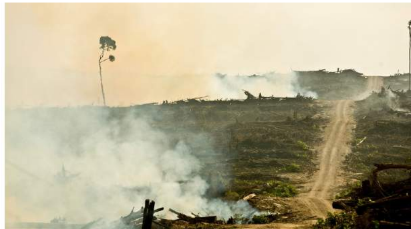
Miljøkrav: Det offentlige skal skygge unna produkter som bidrar til rasering av regnskog. (Side: David Gilbert/RAH)